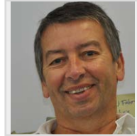
Gert Lefèvre Kreis Bergstraße